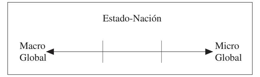
Figura 1. El continuo Global-Local basado en Lefebvre, 2000

Blommaert (2006a), sin embargo, aporta la idea de que la escala es indexada en forma vertical, no horizontal. Los eventos y procesos de la globalización ocurren a diferentes niveles de la escala, donde el nivel micro/local se halla en el nivel inferior de la escala, el macro/global en el nivel superior, y los fenómenos intermedios, tales como el Estado-nación, por ejemplo, se intercalan en los niveles medios.